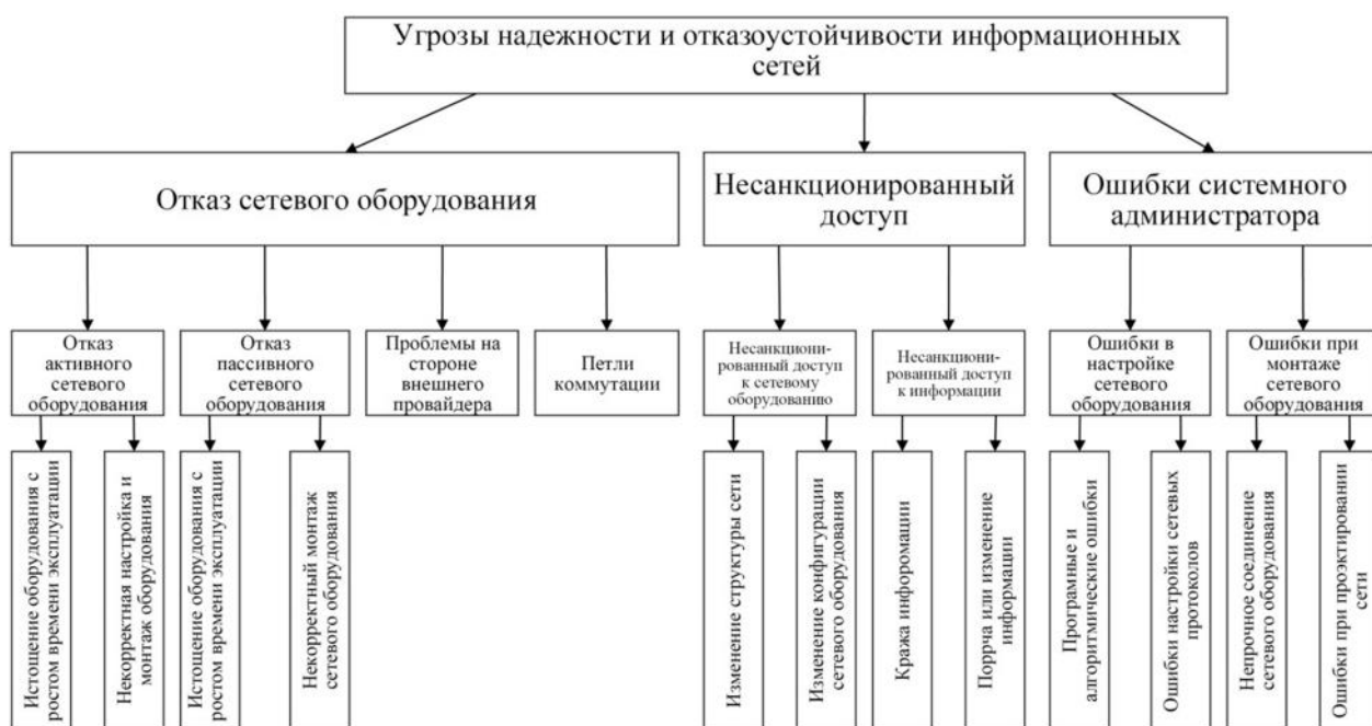
Рис. 2. Классификация угроз надежности и отказоустойчивости информационных сетей

Несанкционированный доступ к сетевому оборудованию или